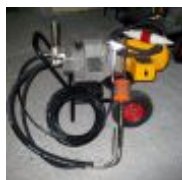
Вагнер 7000.380 88000р.; Вагнер 7000.220 95000р.; Вагнер 7000.бенз. 105000р. SPX7000 7,2 л/мин 85000р. TR 10000.220 124000р.