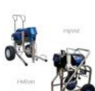
Easy spray 0,019" 29000р.; SPT 210 0,019" 51000 р.; SPT 490 0,021" 71000 р.; SPT 670 0.035" 180000 р. SPT 650 0.035" 220000 р.