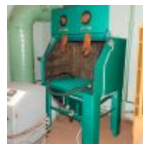
КСО-110-И-ФВР-М 265500р. КСО-110-Н-ФВР-М 335700р. КСО-130-И-ФВР-М 280800р. КСО-130-Н-ФВР-М 350100р. КСО-115-Н-ФВР-М 366200р. КСО-135-Н-ФВР-М 376200р.

Окрасочное оборудование - окрасочный агрегат высокого давления с пневматическим и безвоздушным распылением, выполняющее всевозможные окрасочные работы. Выбирая ту или иную систему воздушного распыления, следует иметь полную информацию о предполагаемом к использованию окрасочном составе. При этом особое внимание уделяется плотности, вязкости и сухому остатку.